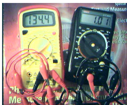
Figura 1 - DMM come generatore di corrente

L'intensità di corrente può essere variata modificando la scala di lettura dell'ohmetro. Con l'utilizzo di due DMM, uno impostato come ohmetro e l'altro come amperometro, collegando tra loro i puntali dello stesso colore (rosso-rosso e nero-nero), si può misu-